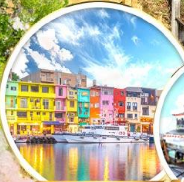
ท่าเรือสายรุ้ง