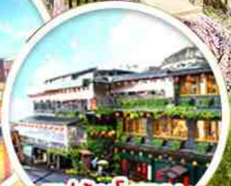
หมู่บ้านโบราณ จีวเฟิน