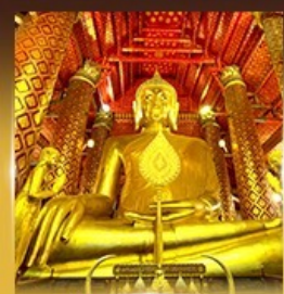
วัดพันธุเชิงวรวิหาร