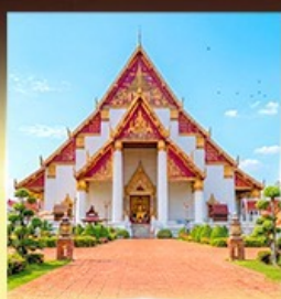
วิหารพระมงคลมถิต