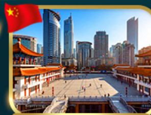
เขื่อนตึกไควซิงโหล