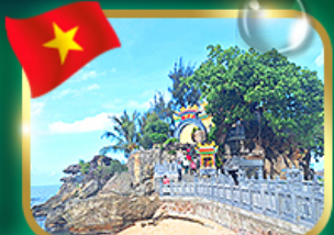
สักการะขอพรศาลเจ้ามังกร