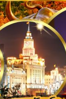
เดอะมันด์