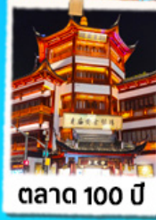
ตลาด 100 ปี