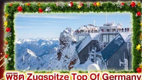
พีชิต Zugspitze Top Of Germany