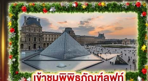
เจ้าชมพิพิธภัณฑ์ลูฟร์