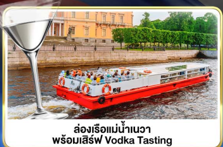
ล่องเรือแม่น้ำเนวา พร้อมเสิร์ฟ Vodka Tasting

📅 เดินทาง : 14-21 มิ.ย.69 / 28 มิ.ย.-05 ก.ค.69 / 24-31 ก.ค.69