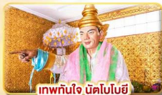
เทพทันใจ นัตโอบอัย