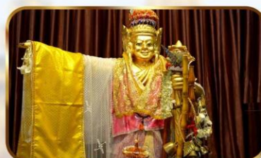
เทพทันใจโจ้เข้า