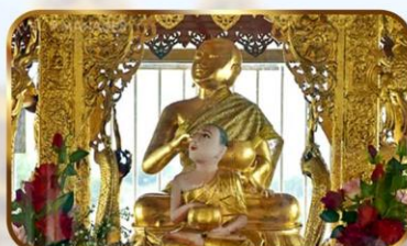
ขอพระอุปคุต ปางจกบาตรเยิมมาร