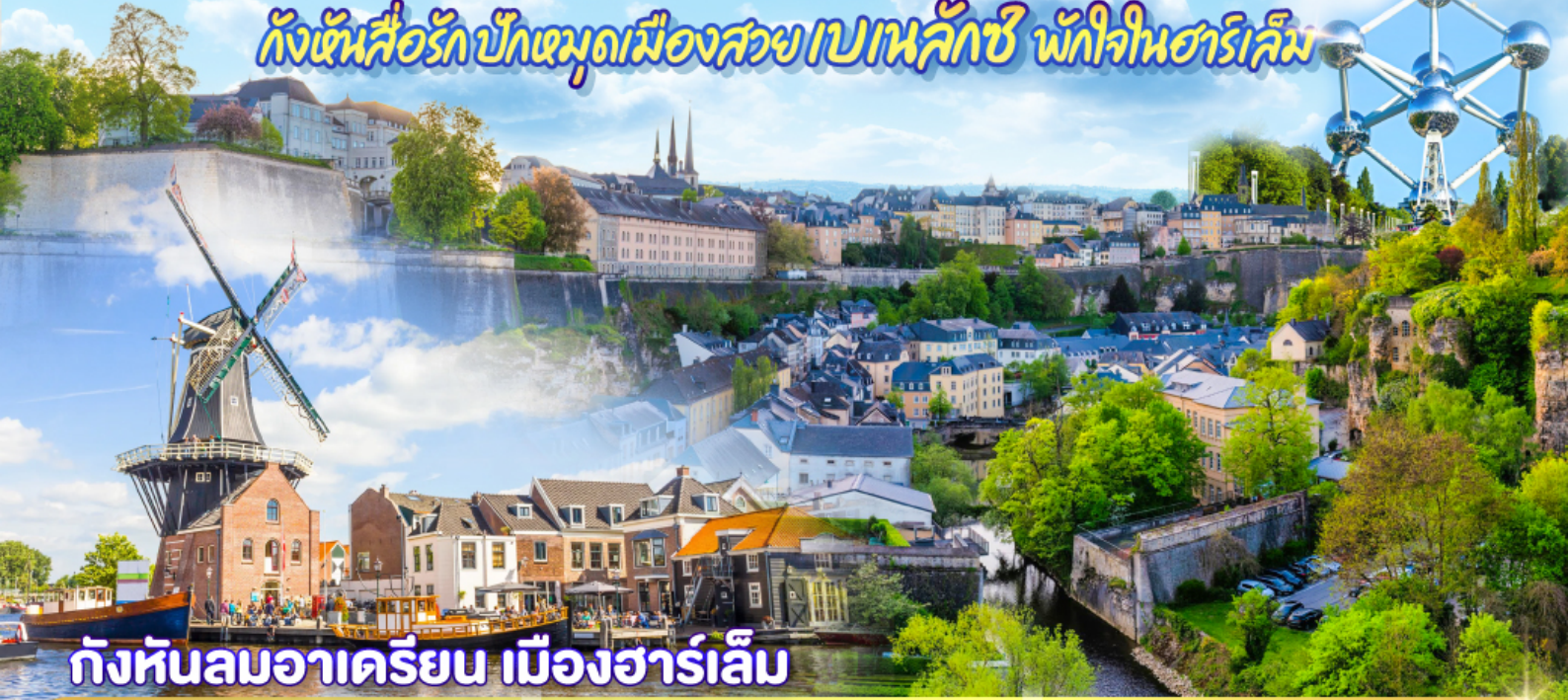
กังหันลมอาครियิน เมืองฮาร์เล็ม