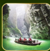
สวน Alice's Garden ล่องเรือแม่น้ำใต้ดินกุ้ยฮิว