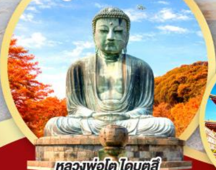
หลวงพ่อโต ไคบุตสึ