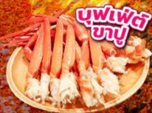
บุฟเฟ่ต์ ซาซิมิ

ชมใบไม้เปลี่ยนสี อุโมงค์ใบเมเปิ้ล โมมิจิโคโร