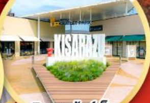
มิตซึย เอ้าท์เล็ต พาร์ค คิชะระชู