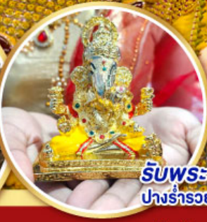
รับพระพิฆเนศวางร่ำรวย ท่านละ 1 องค์