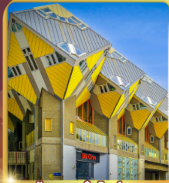
บ้านลูกเต๋า โคกคูนุส

“ล่องเรือหลังคากระจก” ชมกรุงอัมสเตอร์ดัม