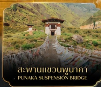
สะพานแขวนพุนาคา PUNAKA SUSPENSION BRIDGE