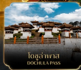
โดชูล่าพาส DOCHULA PASS