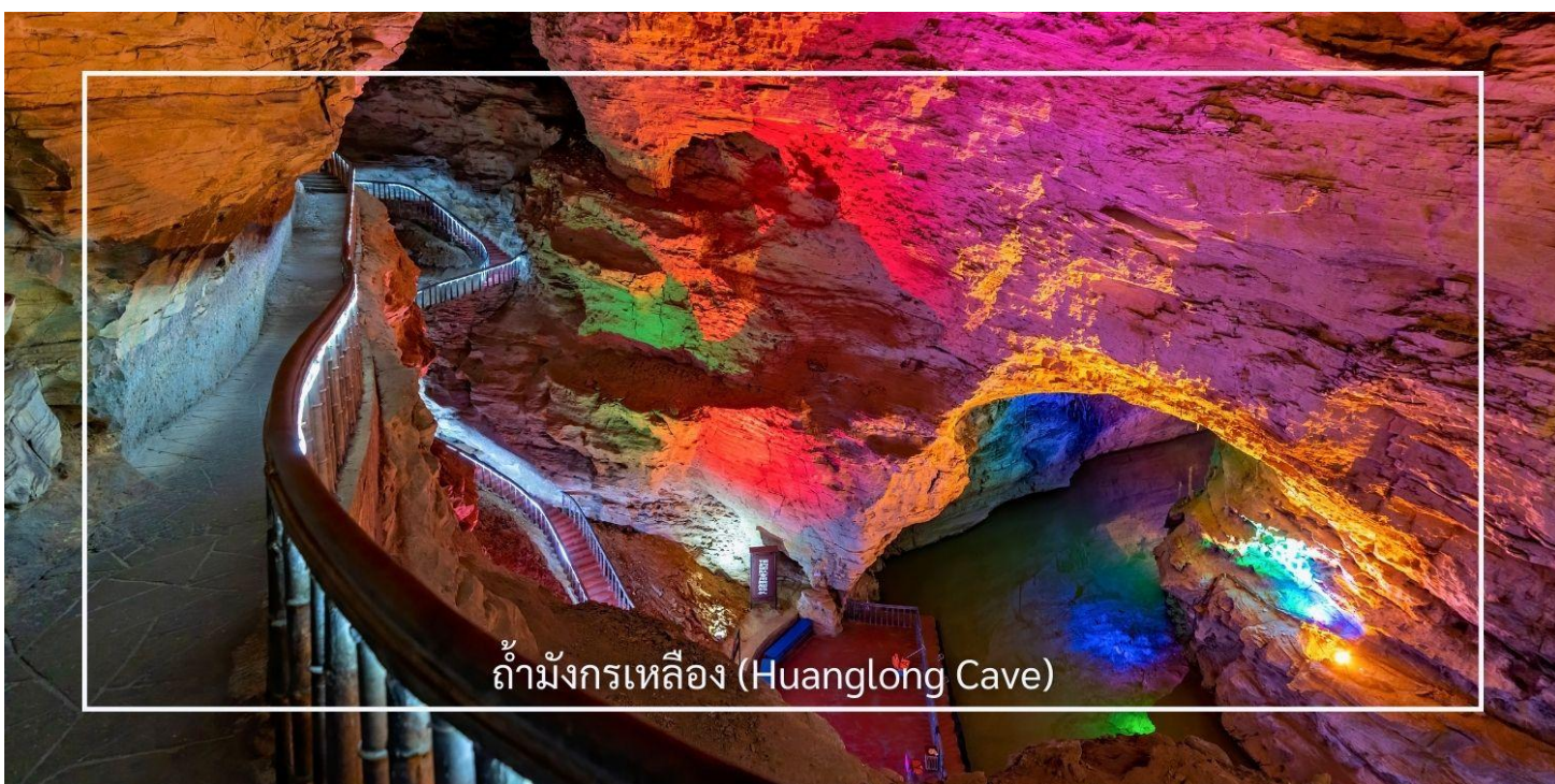
ถ้ามังกรเหลือง (Huanglong Cave)

ถ้ามังกรเหลือง หนึ่งในถ้ำหินงอกหินย้อยที่ยิ่งใหญ่และงดงามที่สุดของเมืองจางเจียเจี๋ย แหล่งท่องเที่ยวทางธรรมชาติที่ได้รับการยกย่องว่าเป็น “พระราชวังใต้พิภพ” แห่งดินแดนอุหลิงหยวน ถ้ำแห่งนี้มีโครงสร้างขนาดใหญ่ แบ่งออกเป็น 4 ชั้น ภายในประกอบด้วยห้องโถงกว้างใหญ่ ลำธารใต้ดิน บึงธรรมชาติ และแนวระเบียงหินที่ทอดยาวอย่างน่าตื่นตา ความมหัศจรรย์ของหินงอกหินย้อยซึ่งก่อตัวสะสมมาเป็นเวลาหลายล้านปี ได้รับการจัดแสงอย่างสวยงาม ช่วยขับเน้นรูปร่างแปลกตาให้โดดเด่น ราวงานศิลป์จากธรรมชาติ สัมผัสประสบการณ์ ล่องเรือชมแสงสีภายในถ้ำ โดยเรือจะนำท่านลัดเลาะไปตามสายน้ำใต้ถ้ำให้ท่านได้สัมผัสกับความยิ่งใหญ่ของธรรมชาติอันน่าอัศจรรย์ได้อย่างใกล้ชิด