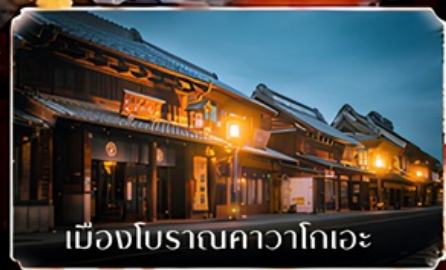
เมืองโบราณคาวาโกเอะ