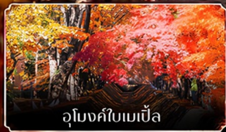
อุโมงค์ใบเมเปิ้ล

04-08 พฤศจิกายน 2569 11-15 พฤศจิกายน 2569