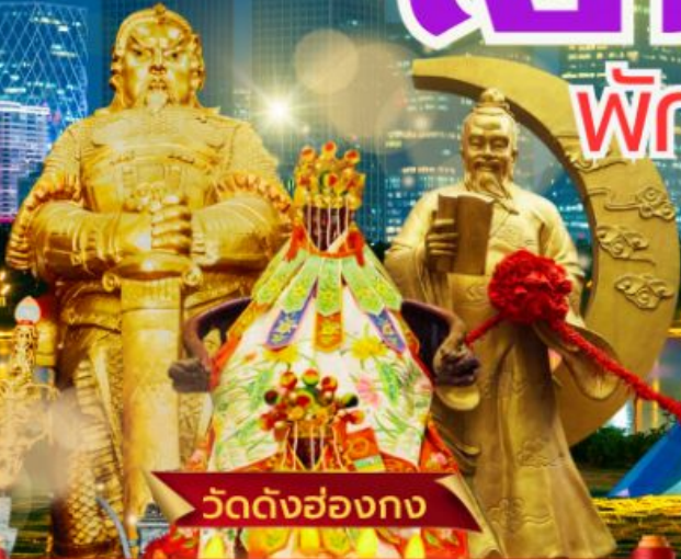
วัดดั่งฮ่องกง