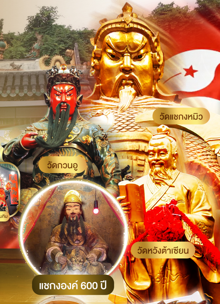
วัดเซกงหมิว