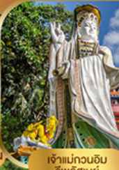
เจ้าแม่กวนอิม ริพลิสซีย์