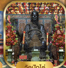
วัดปึกไต้