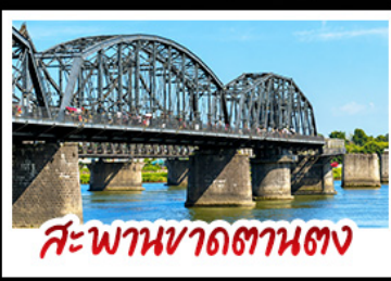
สะพานขาดถานตาง

2 มหัตศวรรษธรรมเนียมชาตระดับโลก "หาดแดงผานจีน" คู่กับ "ถ้ำน้ำเป็นซี" ยื่นมองฝั่งเกาหลีเหนือที่ตามตม • ชมความยิ่งใหญ่ของพระราชวังสี่นหียงทุกัง