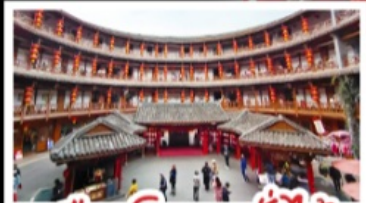
เมืองโบราณลั่วใต้