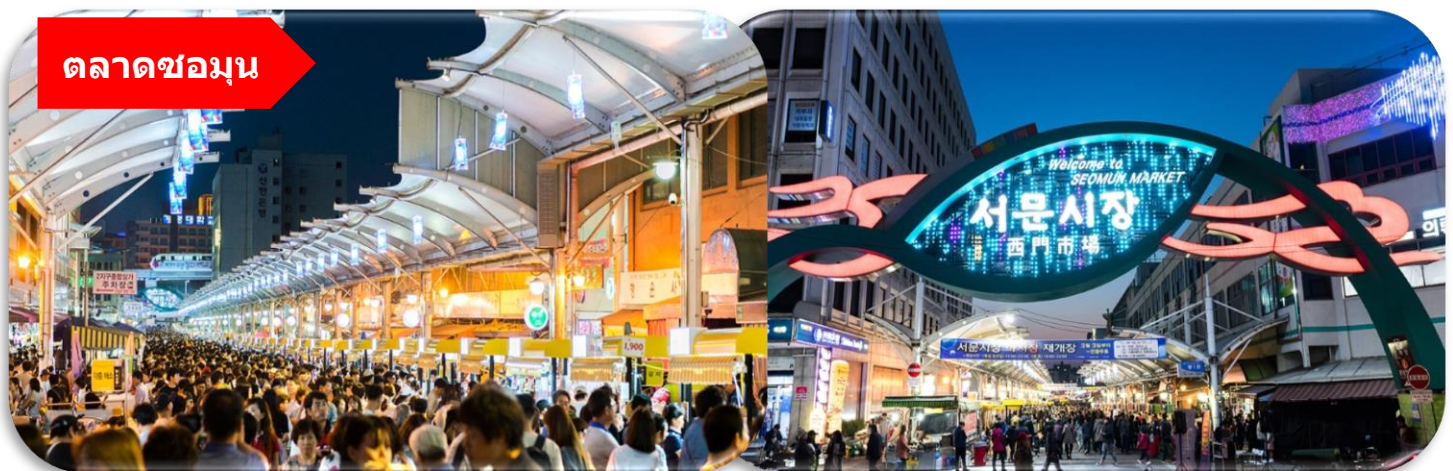
ตลาดชอมุน

นำท่านเที่ยวชม ตลาดชอมุน (Seomun Market) ตลาดพื้นเมืองชื่อดัง ที่มีประวัติยาวนานตั้งแต่สมัยโชซอน และถือเป็นหนึ่งในตลาดดั้งเดิมที่ใหญ่ที่สุดของเกาหลีใต้ ภายในเต็มไปด้วยของกินสตรีทฟู้ด ร้านผ้า เสื้อผ้า ของฝาก และบรรยากาศท้องถิ่นแบบเกาหลีแท้ ๆ ไฮไลท์ห้ามพลาดคือ "ตลาดกลางคืน" ที่คึกคักไปด้วยอาหารพื้นเมืองสุดอร่อย เช่น มังคุดแป็งเคียงแบน และดอกบกกี