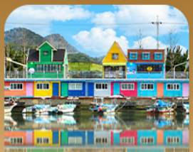
ท่าเรือจังกึม