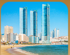
หาดแฮอินแด