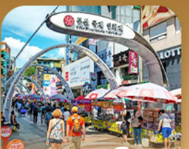
ตลาดนัมโพดง