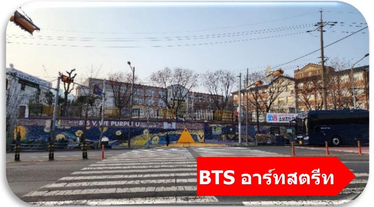
BTS อาร์ตสตรีท

นำท่านเที่ยวชม ตลาดชอมุน (Seomun Market) ตลาดพื้นเมืองชื่อดัง ที่มีประวัติยาวนานตั้งแต่สมัยโชซอน และถือเป็นหนึ่งในตลาดดั้งเดิมที่ใหญ่ที่สุดของเกาหลีใต้ ภายในเต็มไปด้วยของกินสตรีทฟู้ด ร้านผ้า เสื้อผ้า ของฝาก และบรรยากาศท้องถิ่นแบบเกาหลีแท้ ๆ ไฮไลท์ห้ามพลาดคือ "ตลาดกลางคืน" ที่คึกคักไปด้วยอาหารพื้นเมืองสุดอร่อย เช่น มังคุดแป็งเคียงแบน และดอกบกกี