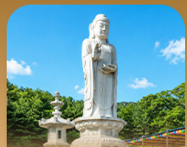
วัดดงฮวาซา

เปิดประสบการณ์เที่ยวเกาหลีสุดคุ้ม บินครั้งเดียว เที่ยวสองเมือง • เช็กอินถนนนักร้องคิมควังซอก สัมผัสเสน่ห์ศิลปะและเสียงเพลง • นั่งรถไฟบุกเบิกชมวิวทะเลปูซาน • หมู่บ้านคิมซอนสีสดใสใต้อ่อนเขื่อนวัดแฮดงยงกุงซาและวัดคงฮวาซา เสริมความเป็นสิริมงคล • แวะชมท่าเรือสีรุ้ง Bunezia ปิดท้ายด้วยชายหาดแฮอินแดแลนด์มาร์กชื่อดัง พร้อมเดินช้อปปิ้ง Walking Street สุดฟิว