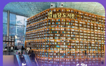
ตึกสมุดดิสตาร์ฟิลด์

เก็บทุกไฮไลท์ ในกรุงโซล ตั้งแต่ความงดงามของ พระราชวังเคียงบ็อก ชมวิวสุดอลังการที่ ดึงลือตเต็ โซลสกาย (รวมค่าลิฟต์ขึ้นตึก) สนุกสุดมันส์ที่ สวนสนุกลือตเต็ เวิร์ล (รวมค่าบัตรเครื่องเล่น) พลิศเพลินไปกับโลกใต้ทะเล ลือตเต็ อควาเรียม (รวมค่าบัตรเข้าชม) เช็กอินแลนด์มาร์กสุดฮิตอย่างห้องสมุดสตาร์ฟิลา โคเอกมอลล์ เดินเล่นย่านฮิป บรูกลินกาหลี ของชุง และช้อปปิ้งซัมเมอร์ชิล สูดฟีน ย่านเมืองคงและองแด