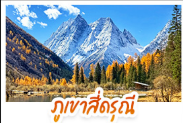
ภูเขาสัตรีณี

ชมทะเลสาบสีฟ้ามรกต ณ จิวจ้ายโกว • เช็กอิน "ภูเขาสัตรีณี" สัมผัสความงดงามของใบไม้เปลี่ยนสี ชมทิวทัศน์ภูเขาหิมะติดกับผืนป่าสีทอง • ชมแอ่งน้ำสีฟ้ามรกตสุดมหัศจรรย์ ณ อุทยานหวงหลง • ช้อปโป๊พ๊อง นกแก้วหลากสี และขนมคบเคี้ยวขึ้นชื่อพิเศษ! มังกรไฟความเร็วสูง 1 ไร่ สูดมิ่งมงคล