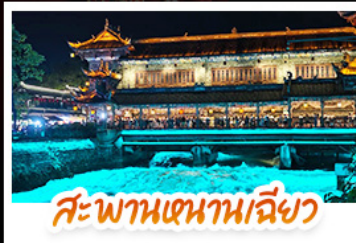
สะพานเจ้านานเฉียว