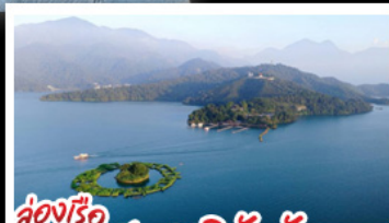
ส่องเรือทะเลสาบสุริยัมจินตรา