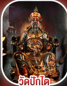
วัดปิกไค