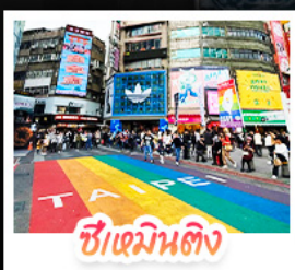
ซีเหมินตง