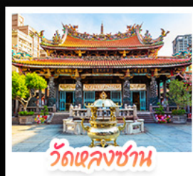
วัดเลกงชาน