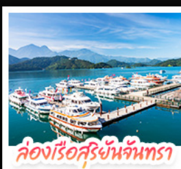
ล่องเรือสุริยันจันทร์

ล่องเรือชมทะเลสาบสุริยันจันทร์ (SUN MOON LAKE) ชมเกาะลาลู แคว-วัดสวนกง • อิสระเดินเล่น หมู่บ้านอิต้าซ่า • นั่งรถไฟเล็กโบราณ (1 สถานี) สัมผัสบรรยากาศเส้นทางรถไฟสายธรรมชาติ • ตะลุย ไทจงไม้มาร์เก็ต แหล่งรวมแฟชั่นและสตรีทฟู้ด • ช้อปปิ้งย่าน ซิเหมินตง (XIMENDING) ถ่ายรูปแลนด์มาร์ค ตึกไทเป 101 • ช้อปปิ้งกังหนว่ที่ MITSUI OUTLET PARK ชมความสวยงามของ อนุสรณ์สถานเจียงไคเช็ค • ขอพรความรักที่ วัดหลงซาน ชมโศกหินเศียรราชินีที่ เย่หลิว • ชมบรรยากาศเมืองเก่าที่ จิวเฟิน