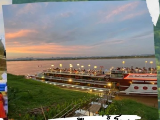
ล่องเรือแม่น้ำโขง