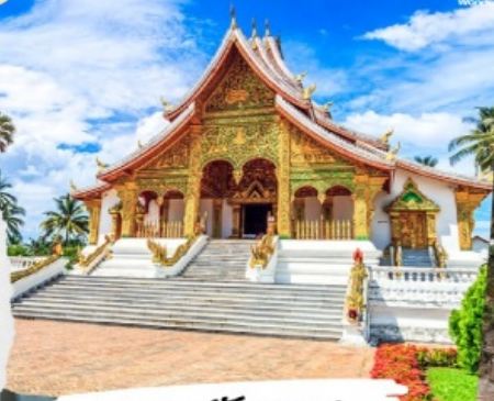
พระราชวังหลวง