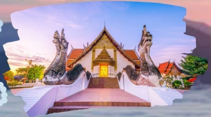
วัดกুমินทร์