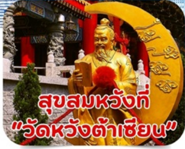
สุขสมหวังที่ "วัดหวังต้าเซียน"

*ราคาเริ่มต้นที่ 4,555.- บาท/ท่าน วันนี้-ธ.ค.67