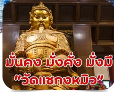
มันคง มั่งคั่ง มั่งมี "วัดเซกองหมิว"