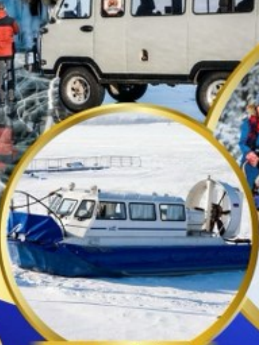
รถตู้รัสเซีย UAS ขับเคลื่อนสี่ล้อบนน้ำแข็งทะเลสาบไบคาล