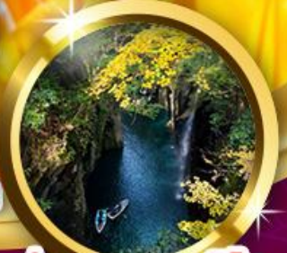
ช่องเขาทาคาชิโฮ

เที่ยวชมหมู่บ้านคลาสสิกแสนสวย ยูฟูอินฟลอริล จิโกกุ สีสันของบ่อนรกแห่งเมืองเบนปุ ที่งดงามราวกับสวรรค์ “ช่องเขาทาคาชิโฮ” ที่มีทั้งธรรมชาติ สายน้ำ และบรรยากาศเหมือนอยู่ในเทพนิยาย Huis Ten Bosch สวนสนุกที่สุดในคิวชู