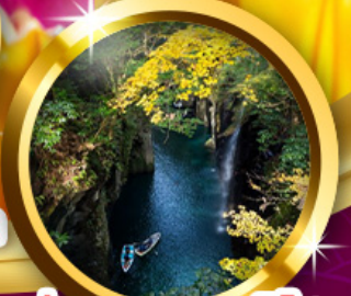
ช่องเขาทาคาชิโอะ

SHOP ยานเกินจิน Shopping ยานโทซุฟรีเมี่ยมเจ้าท์เลียต