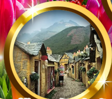
หมู่บ้าน ยูฟูอินฟลอริล