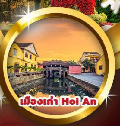
เมืองเก่า Hoi An

“นั่งกระเช้าที่ยาวที่สุดในโลก ล่องเรือกระดังชมวิถีหมู่บ้านกิมทาน สู่เมืองบานาฮิลล์ ชมวิวสะพานมือสีทอง เมืองมรดกโลกฮอยอัน”