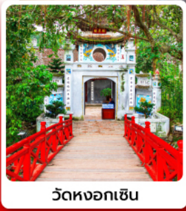
วัดห่งอกเซิน