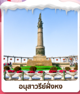
อนุสาวรีย์ฟ่งหง