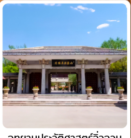
อุทยานประวัติศาสตร์จิวจวน