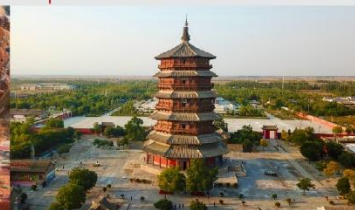
วัดเจดีย์ไม้ มู่ต้า

*ทางบริษัทฯ ขอสงวนสิทธิ์ในการสลับโปรแกรมทัวร์ตามความเหมาะสมขึ้นอยู่กับสถานการณ์หน้างาน โดยคำนึงถึงผลประโยชน์ของลูกค้าเป็นสำคัญ