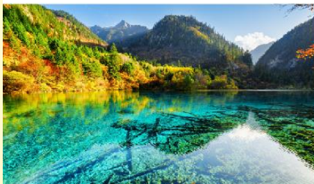
อุทยานแห่งชาติจิวจ้ายโกว