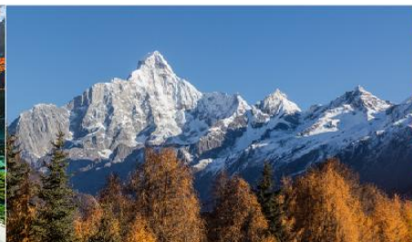
ภูเขาสี่ดรุณี