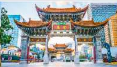
ประตูม้าทอง คุนหมิง