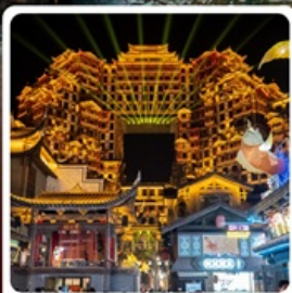
ตีทมหัศจรรย์ 72