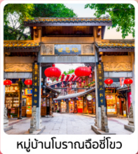
หมู่บ้านโบราณฉือซีโฮว