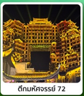
ตีทิมหัดจอร์รี่ 72

● โอไฮโอ อุทยานเทียนเหมินซาน ประตูสวรรค์ ตีทิมหัดจอร์รี่ 72 หมู่บ้านโบราณฟูรงเจิน ภูเขาไรซ่าอู่เจียโต อุทยานซื่อจื่อควนด่านสิงโต