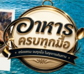
ปิ้งย่าง