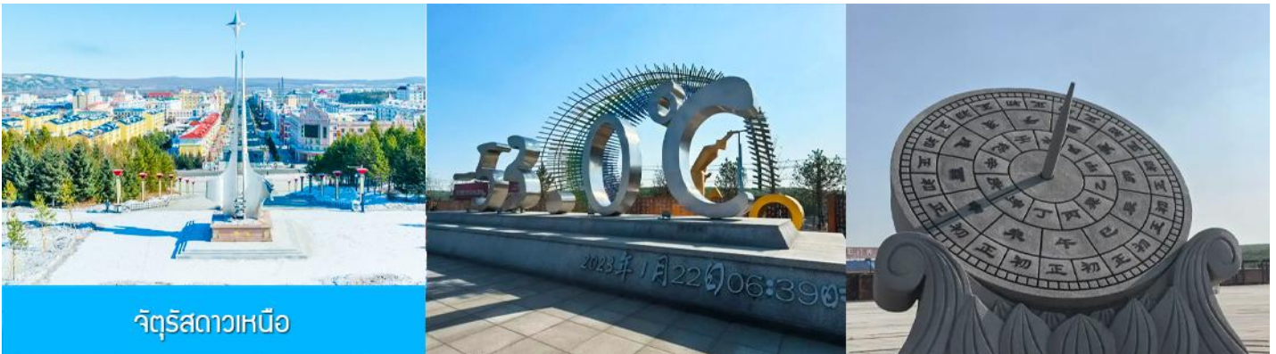
จัตุรัสดาวเหนือ