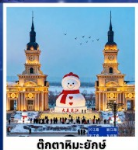
ตึกตาสหิมะยักษ์