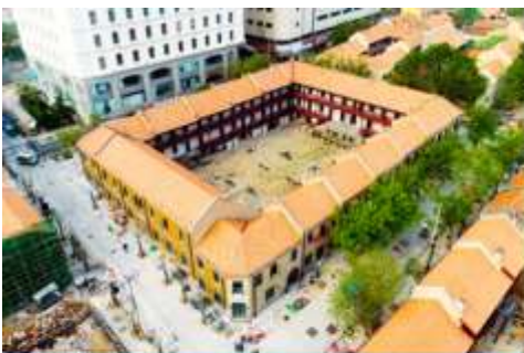
เมืองเก่าเยอรมัน ทรอกว้างซิวหลี่