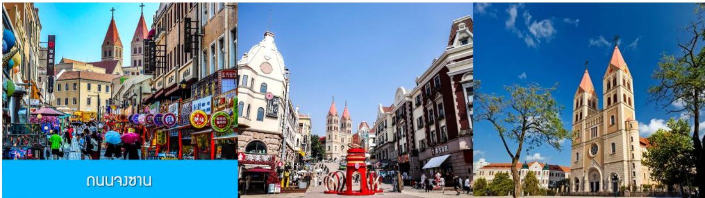
ถนนวงเวียน