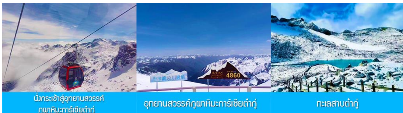
นั่งกระเช้าสู่อุทยานสวรรค์ ภูผาหิมะการ์เซียต้ากู่

พักที่ YARI INTER HOTEL 4* หรือ โรงแรมระดับเดียวกันท้องถิ่น