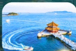
สะพานฉานเฉียว