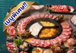
ซูฟไฟ้ชาบู