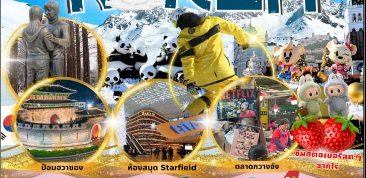
ป้อมฮวาซอง